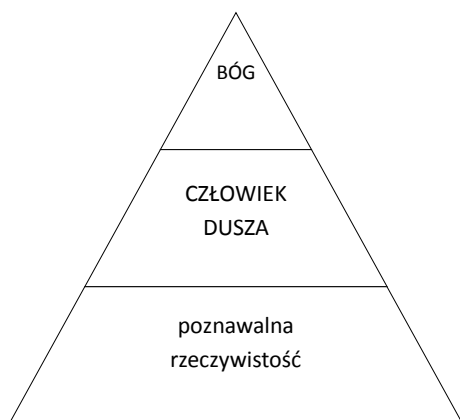
Rysunek 1. Struktura rzeczywistości u Komeńskiego (przekrój podłużny)

Program Komeńskiego jest maksymalistyczny. Obejmuje wszystko, a jako projekt neoplatoński i chrześcijański zarazem musi właśnie taki być. Idea pansofii jest konstruktem przy tych założeniach koniecznym (Por. Komeński, 1964: 553-558). Czy jednak swoim zasięgiem rzeczywiście obejmuje wszystko? Odpowiedź brzmi: „tak i nie”. Wszystko zależy od punktu naszego spojrzenia na projekt Komeńskiego. Modelowo można go przedstawić jako figurę stożka (rys. 1). Na samym szczycie jest Bóg, poniżej człowiek ze swoją trójdzielną duszą, a jeszcze niżej cała poznawalna dzięki duszy rozumnej rzeczywistość. Jednak, jak w modelu neoplatońskim, wszystko jest oświetlane przez Boga, to on gwarantuje oświecenie i wszystko, co jest zgodne z jego objawieniem jest prawdziwe (Komeński odrzucił m.in. dlatego teorię Kopernika jako niezgodną z mozaistyczną interpretacją powstania i działania świata).